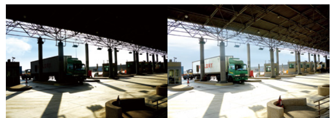
Ohne WDR Pro