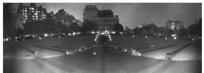
Panoramasiht mit Infrarot-Beleuchtung